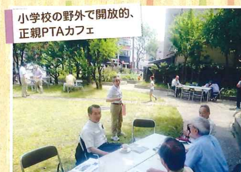
小学校の野外で開放的、 正親PTAカフェ