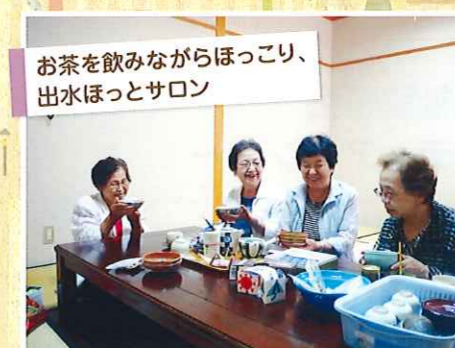
お茶を飲みながらほっこり、 出水ほっとサロン