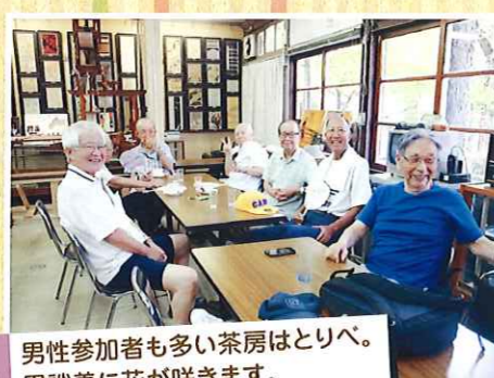
男性参加者も多い茶房はとりべ。 男談義に花が咲きます。