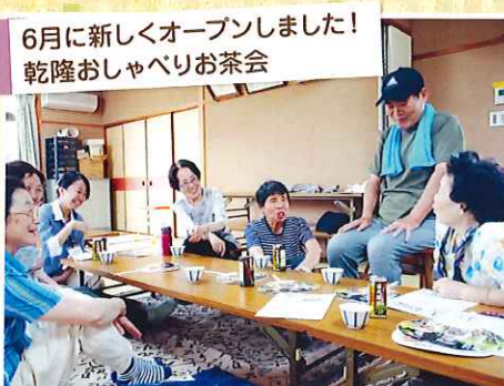
6月に新しくオープンしました! 乾隆おしゃべりお茶会