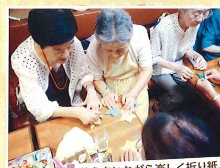
教えあいながら楽しく折り紙、 京極スマイルサロン