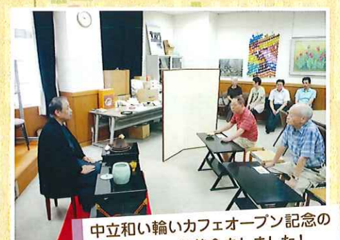
中立和い輪いカフェオープン記念の 第一回目は、お茶会をしました!