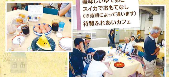
美味しいゆで卵と スイカでおもてなし (※時期によって違います) 待賢ふれあいカフェ