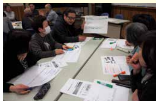
コロナ禍前に行われていたまちづくり活動の様子。